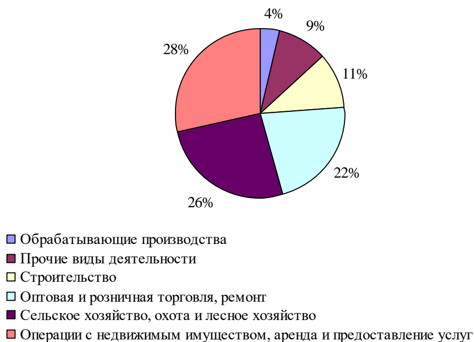
Рисунок 1 – Инвестиции в основной капитал малых предприятий в разрезе отраслей в 2016 г., %

Иллюстрации каждого приложения обозначают отдельной нумерацией арабскими цифрами с добавлением перед цифрой обозначения приложения (например, рисунок А.3). При ссылках на иллюстрации следует писать «...в соответствии с рисунком 1» при сквозной нумерации и «... в соответствии с рисунком 1.1» при нумерации в пределах главы.