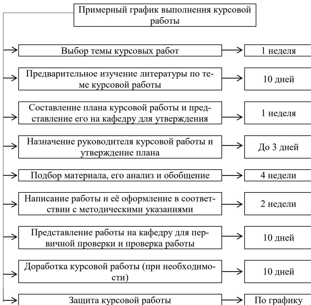
Рисунок 1 – Этапы выполнения курсовой работы

Курсовая работа выполняется в сроки, определенные учебными планами по данному направлению. Завершенная курсовая работа передается студентом на кафедру для рецензирования не позднее чем за месяц до начала сессии. Срок рецензирования работы – не более 10 дней.